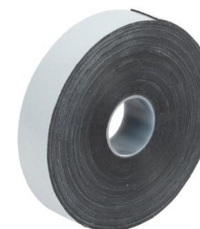
Рисунок 2 Лента самоспекающаяся СП 0, 76 x 19