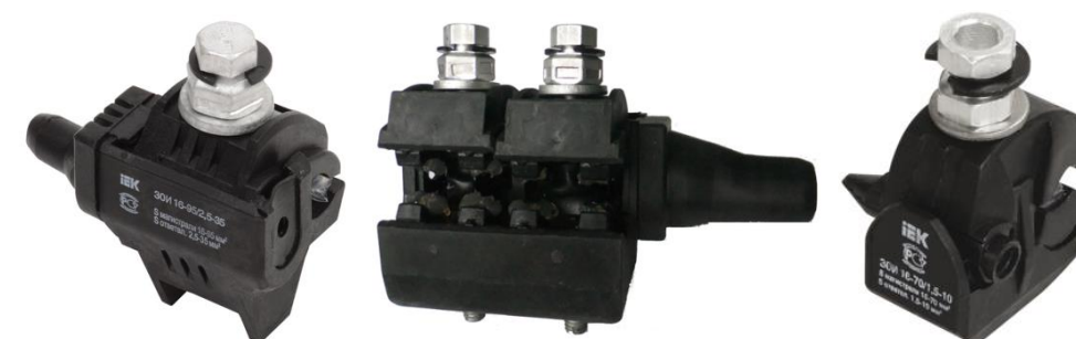
Рисунок 3 Прокалывающие изолированные зажимы ЗОИ

Крепежные болты имеют срывную головку и не требуют динамометрических ключей для монтажа. В случае необходимости можно демонтировать при помощи ключа.