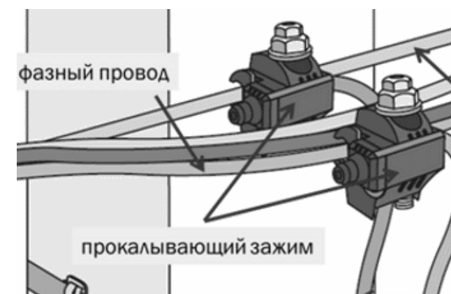
Рисунок 4 Подключение к ВЛИ прокальвающими зажимами

Прокальвающие зажимы надеваются на провод и затягиваются через срывную верхнюю головку болта. Она дает определенное усилие прижатия зубцов к проводу, чтобы обеспечить электрический контакт и при этом не повредить его. В дальнейшем зажим можно снять гаечным ключом, отвернув нижнюю головку демонтажа, которая остается невредимой.