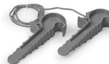
Рисунок 1 Отделительные клинья